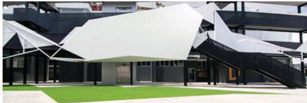
Presentación del curso académico 2016/17 y Bienvenida a los nuevos a estudiantes

Disponemos de 13 lugares de examen (8 en las Islas Canarias, 1 en Madrid, 1 en Barcelona, 1 en Sevilla, 1 en Elche y 1 en León). Nuestra plantilla de personal docente está formada por más de 150 profesores.